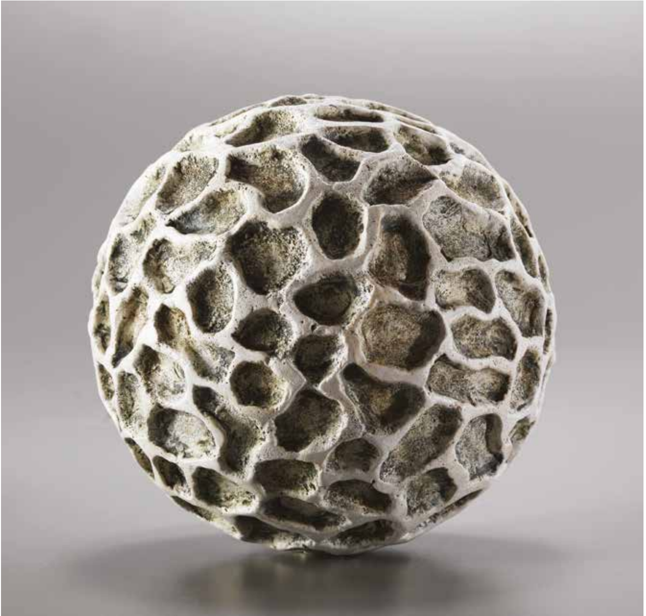
Organic Sphere - 16x16x16 cm. Ler med perlie