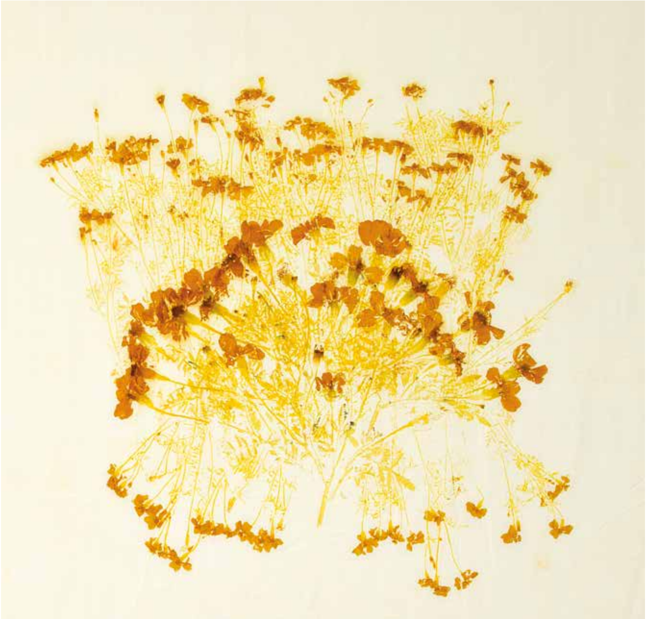
Buket-busk fra Kongens Nytorv, 2010.