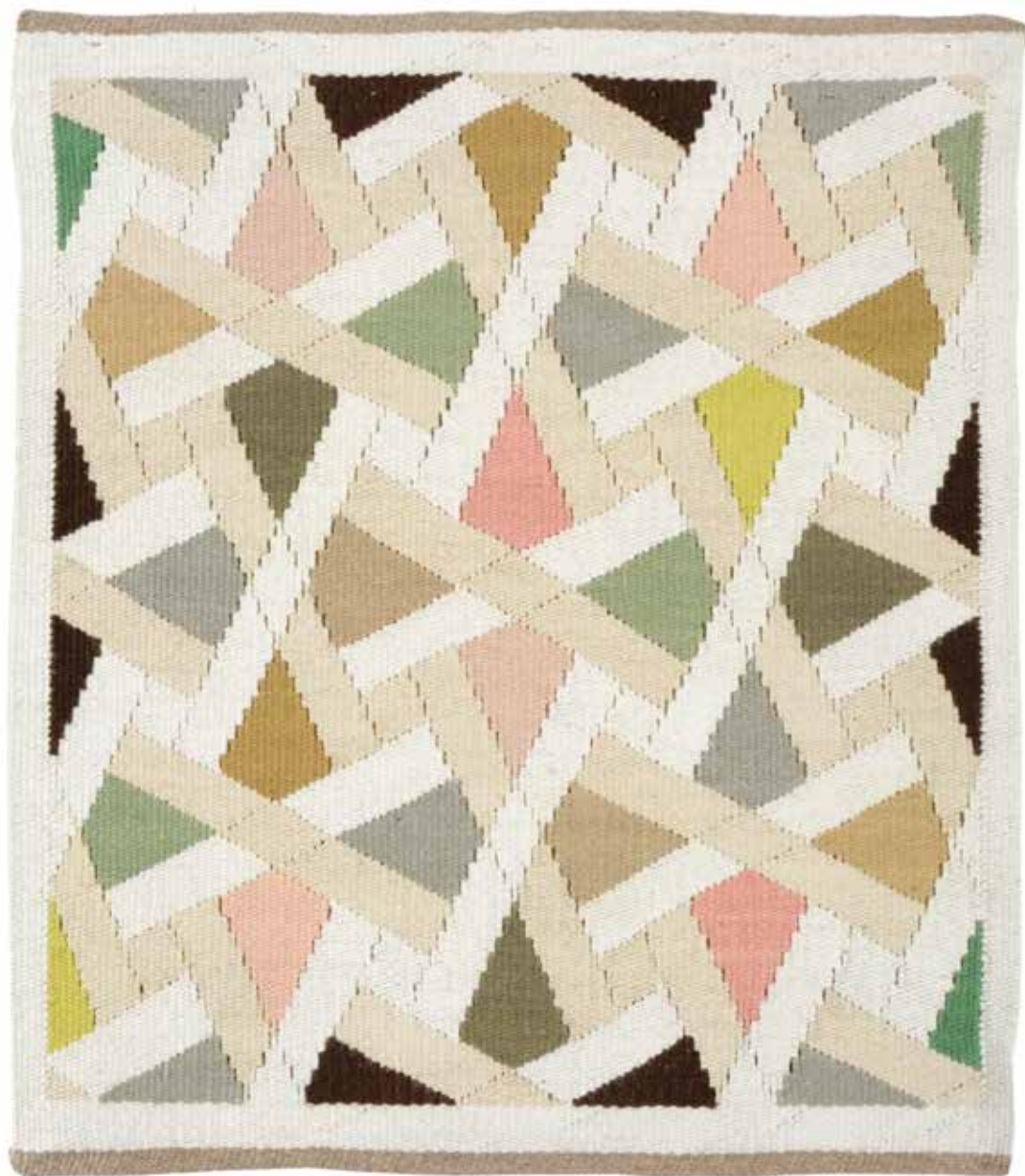
Kalajdoskopiske figurer, vævet billedtæppe, 30x34 cm.