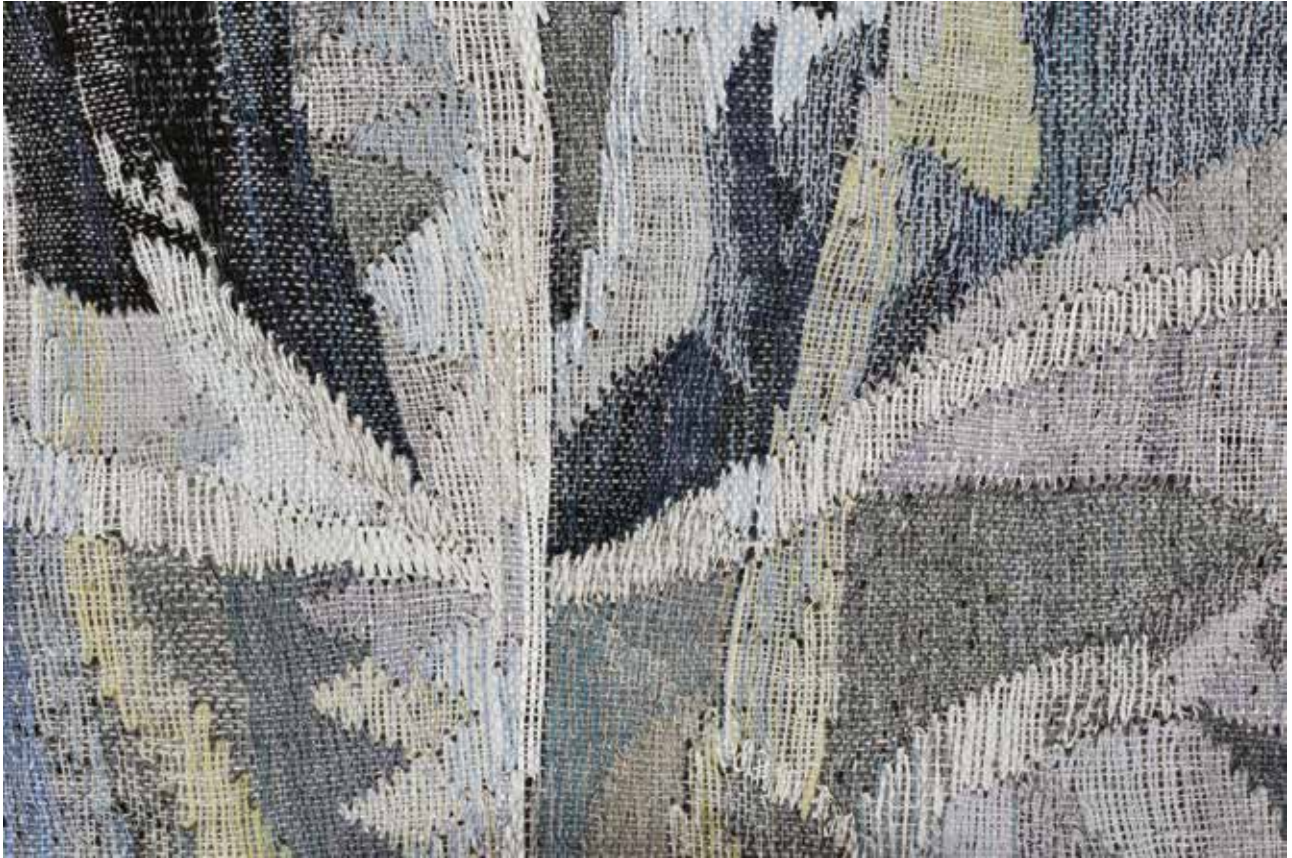
Himlen over mig, detalje.