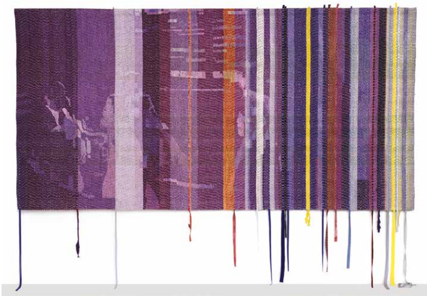
Nocturne - 150 cm (plus 'frynser') x 300 cm. Bomuld, hør, silke og laserskårde stofstrimler. Vævet i bølgekiper med opluk.