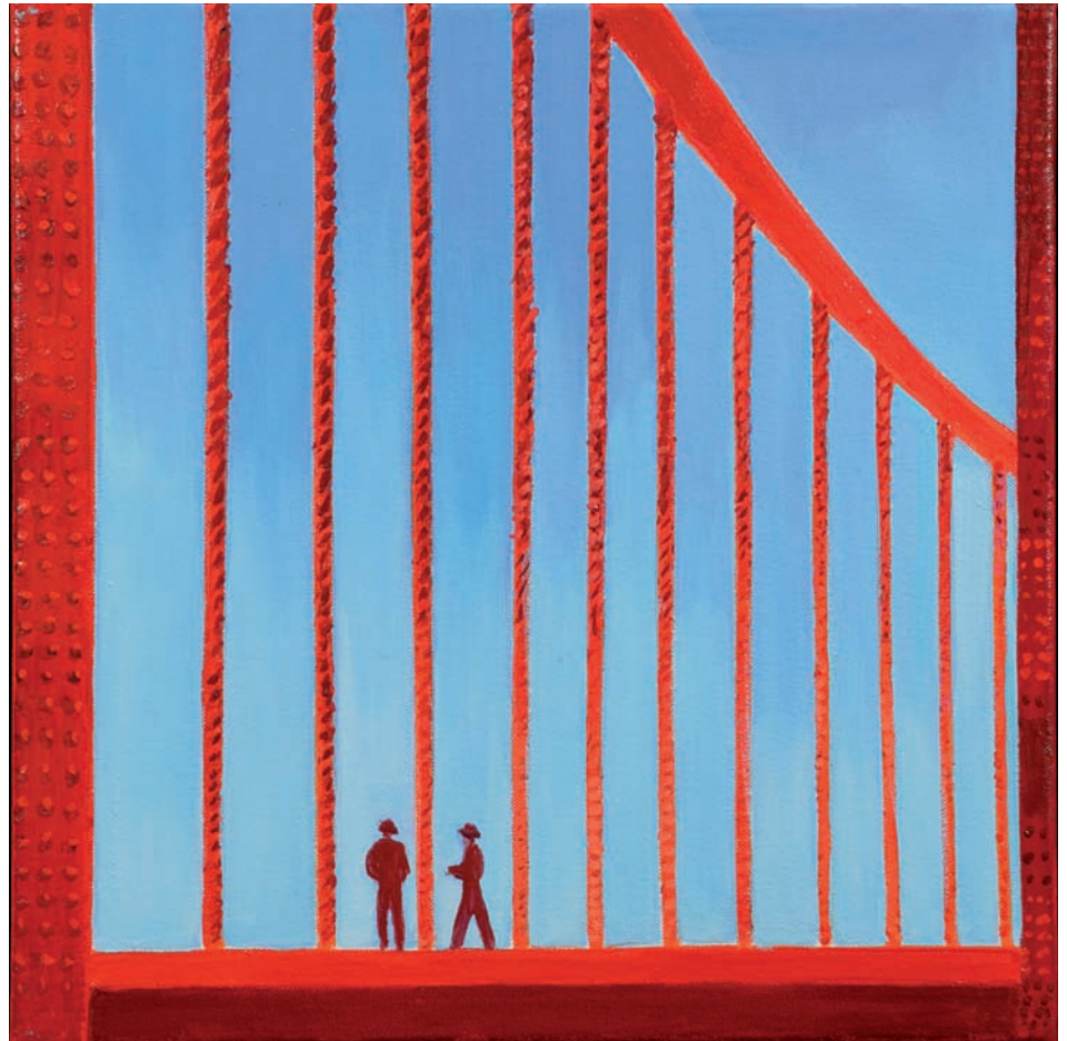
Søren Elgaard. Golden Gate Bridge, 2004