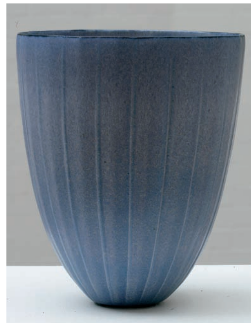
Tove Anderberg Efter solnedgang. Blækhat, 2009