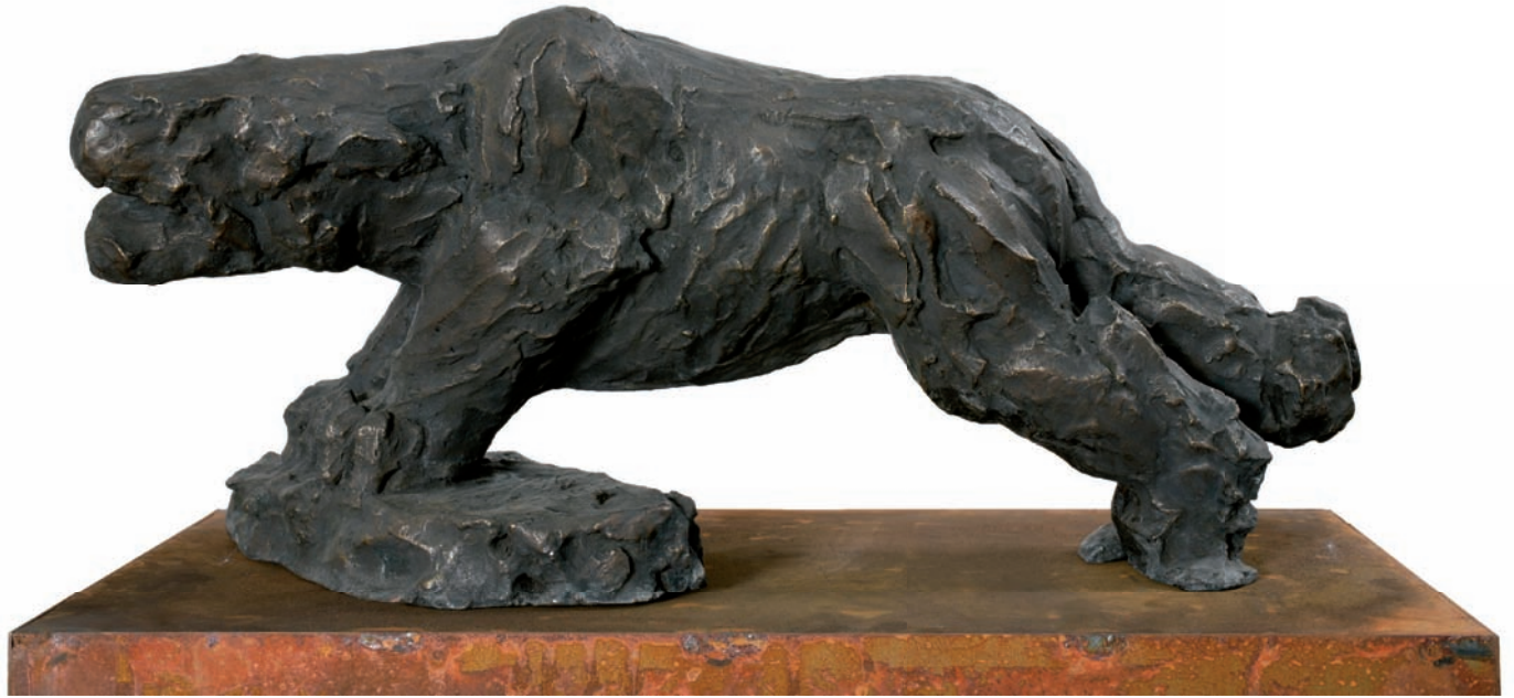
Claus Ørntoft. Ulvetid, (2008)